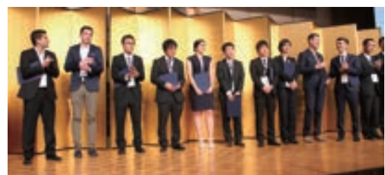
Fig. 12 Excellent Presentation Award