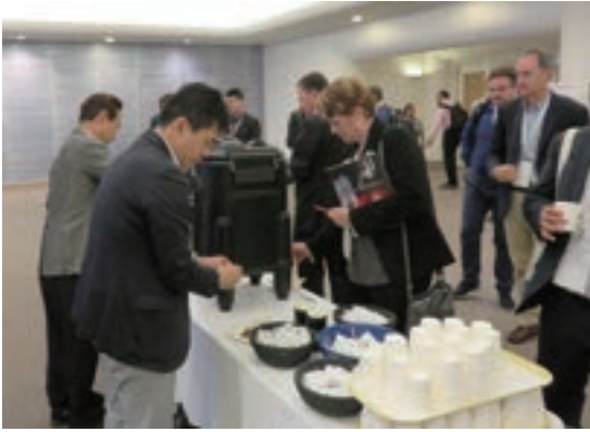
Fig. 2 Coffee Break