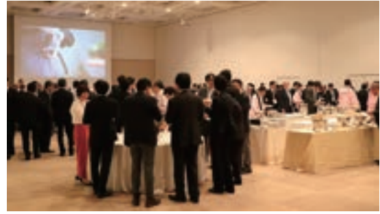
Fig. 5 Welcome Party

ウェルカム・パーティは、13日17:00から、パシフィコ横浜の3階の会議室およびその前の横浜港の夜景を眺めら