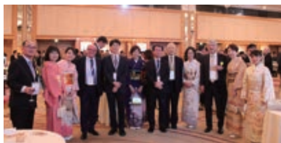
Fig. 16 Banquet