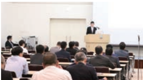
Fig. 8 Presentation