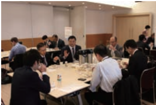
Fig. 7 Breakfast Meeting