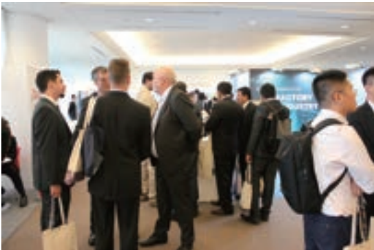
Fig. 20 Exhibition