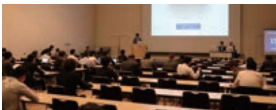
Fig. 9 Presentation