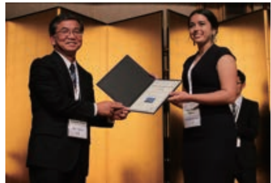
Fig. 11 Excellent Presentation Award