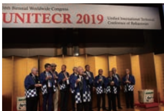
Fig. 15 Kagamiwari