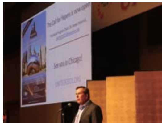
Fig. 17 Next UNITECR

バンケットでも「和のテスト」とするため、両委員長のご令室や司会者を含め10数名の女性の方々には和装をして頂いた。また、インターバルでは、琴や太鼓などの和楽器の演奏が行われた。さらに、実行委員によって各地から集められた日本酒（地酒）を参加者に振る舞った。