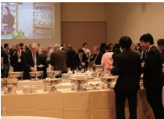
Fig. 4 Welcome Party

会議では、「和のテスト」を全面的に示すように工夫した。前述の法被もその一つであるが、コンgresバッグは和柄の綿のトートバッグとし、座長への記念品として江戸小紋柄の風呂敷を選び、ランチは「お弁当」としたほか、後述のバンケットでも工夫した。