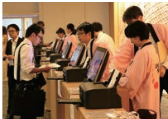
Fig. 1 Registration

会議運営の点では、参加受け付け、新規登録、クローケ、講演発表データのホストへの受け渡し、ランチ (弁当) の配付、コーヒブレイク用の飲み物の準備、会場への誘導、一般講演発表の運営など、全般的には概ね順調にできたものと考えている。