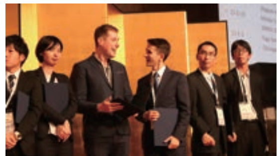
Fig. 13 Excellent Presentation Award