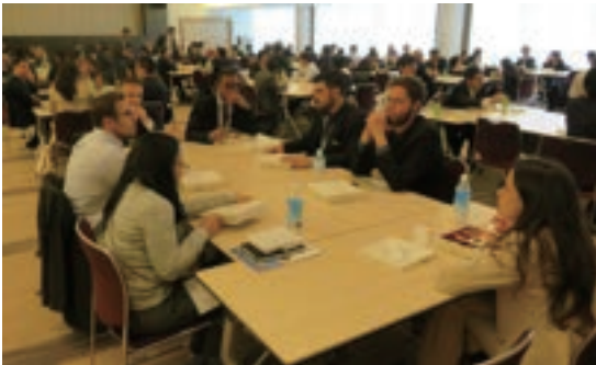
Fig. 3 Lunch