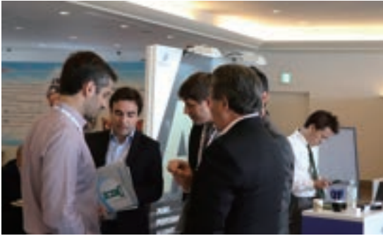
Fig. 18 Exhibition