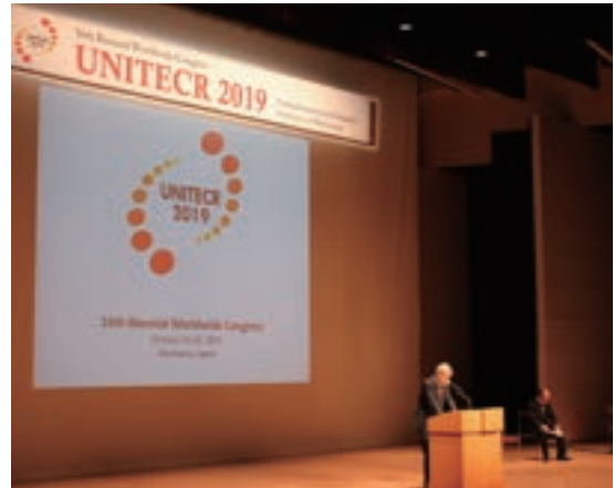
Fig. 6 Opening Ceremony

れる景色の良いホワイエを会場として開催された。台風の影響で、特に海外からの参加者の来日が遅れて、参加者は比較的少なかったものの、約300名に達して、旧交を温めあった。