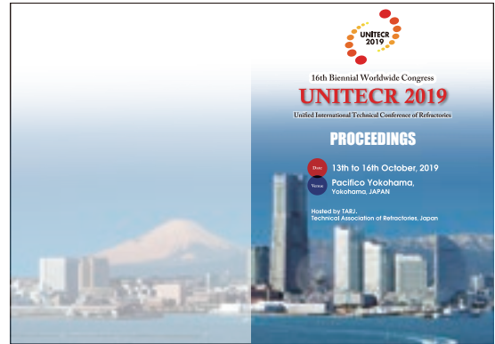
Fig. 10 Proceedings

Award）を贈ることを計画し、講演発表申込時からそれをアナウンスした。その効果もあるのか、その対象講演は、241件中108件となった。Proceedingによる書類審査、および講演発表の審査を経て、17名の若手の研究者に若手優秀発表賞を贈呈した。受賞者は、バンケットで表彰された。